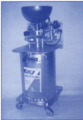
▲AMGスプレー加工装置