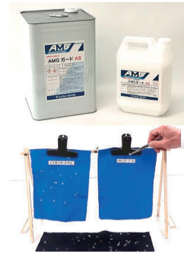
AMGガードAS (静電気防止効果)を動画で公開中

この時期、寒さもさうだが嫌な1つが静電気による「パチパチ」や「パチツ」。エイムジー(株) (AMG有馬義、電話075・9333・7171)では、静電気が起るメカニズムと合わせて、その対策に高い撥水性を備えた加工剤で手軽にできる方法を紹介している。