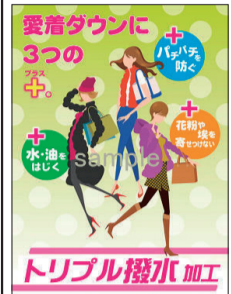
「トリプル撥水加工」のポスター