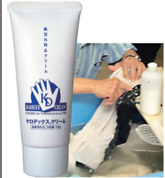
ケロデックス クリーム

平年を上回る気温だった寒さも12月から一転、本格的な冬が到来。今年もしっかりとウイルス対策、健康維持が欠かせない。寒さと言えは、お湯・洗剤等による肌の荒れ、乾燥によるかさつきが気になる時期。そこでこまめな消毒はさらに荒れる原因となり、こちらの対策とケアも必要だ。A・L・ウィルソン・ケミカル社「Goシリーズ」極東代理店の(株)佐鳴横