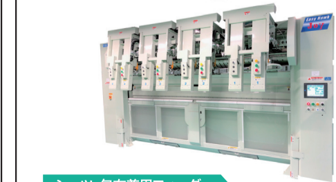
Easy Hawk Joy シーツ・包布兼用フィーダー