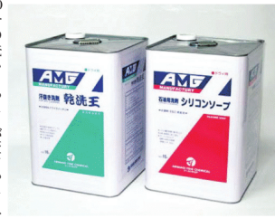
乾洗王&シリコンソープ

では、家庭洗濯機でも、標準洗い12分半程48分程度、MA値が24と非常に低く、収縮率もなしとなっている。以前流行った家庭でドライ衣類が洗えるとした洗濯機や洗剤での洗い方では、トビエ夫して洗わないとMA値が50以上になり、繊維が縮み、なごらや発生するなどのトラブルが発生する結果となっている。